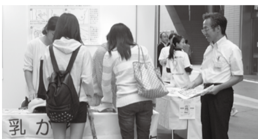
写真上:本会が協力したマンモグラフィ検診車の見学 写真下:乳がんのセルフチェックを体験する参加者

わが国の乳がん死亡率は、0・3ポイントとわずかながら増加傾向にあったが、2012年の人口動態統計で、その理由として、マンモグラフィによる乳がん検診の普及や治療法の進歩などが考えられることから、より大きな効果を得るため、乳がん検診受診率の一層の向上が求められている。イベントの主催者を代表して挨拶した東京都福祉保健局の高橋郁美保健政策部長は、「東京都では、05年度からピンクリボン運動を展開し