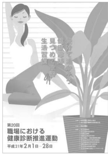
第20回 職場における健康診断推進運動 平成21年2月1日～28日

中央労働災害防止協会と全国労働衛生団体連合会(全衛連)では、2月1日から1カ月間を「職場における健康診断推進運動」期間として、中小企業で働く人たちが対象にした健康診断を推進している。第20回となる今年は「受けて活かそう 健康診断 見つめて改善 生活習慣」をスローガンに、各地でさまざまな取り組みが行われる。これを受けて全衛連東京地区協議会では、この期間中に割安の料金で健康診断を受けてもらえるよう、「働く人の健康診断推進事業」を実施する。本会もこの事業に協力し、専用の窓口を設けて受診を呼びかけている。